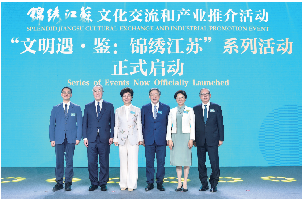
↑↓ 4月14日，“文明遇·鉴：锦绣江苏”系列活动正式开启，通过文化产业推介会、展览展销及昆曲交流等板块，全方位展示江苏的文化底蕴与创新活力。

卓永兴说，江苏拥有深厚的历史文化底蕴和丰富的文化资源，与香港一直保持紧密的文化交流合作。今天的推介会不仅是江苏文化产业的一次精彩亮相，更是苏港两地文化合作的新起点。相信通过这次交流，两地能够找到更多的合作契机，共同推动中