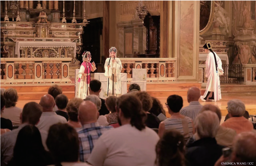
昆剧《西厢记》在意大利克雷马马南蒂音乐厅演出。

当亚得里亚海的晚风吹皱了圣马可广场的倒影, 700 年前意大利旅行家马可·波罗笔下的“东方威尼斯”苏州正以最动听的声音唱响世界。今年 8 月, 昆剧《西厢记》在克雷莫纳与克雷马连演两场; 9 月, 纪录电影《我在苏州学非遗》在威尼斯 M9 博物馆专场推介, 苏州芭蕾舞团原创舞剧《鹊之桥》开启欧洲巡演之旅。在中欧建交 50 周年、中意建交 55 周年、苏州与威尼斯缔结友城 45 周年之际, 三部作品、五城联动、几十位艺术家, 共同把“一带一路”的愿景化作一条可感、可听、可见的江南文化丝带, 飘向亚平宁。