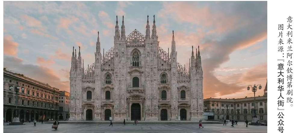
意大利米兰阿尔钦博第剧院。

45 年来, 苏州与威尼斯在文化艺术、科学技术、教育、经济、卫生、体育、环境保护和青少年交流等领域开展交流合作, 为增进两市和两国友谊作出了积极贡献。今年 5 月, 全球历史最悠久、影响力最大建筑艺术