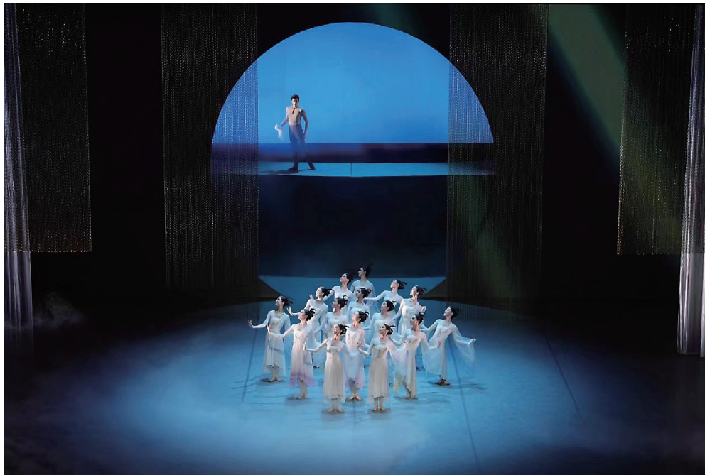
苏州芭蕾舞团原创舞剧《鹊之桥》剧照。

这部纪录电影用一个个“小而美”的人物故事, 串联起苏州非遗的活态群像。金银器匠人与儿子关于“守艺与创新”的碰撞、00 后苏剧演员从龙套到主角的逆袭、御窑金砖师傅 43 年如一日的烧窑人生……这种沉浸式的体验让电影既有纪实的力量, 又不乏情感的温度, 成为具有苏州辨识度和国际