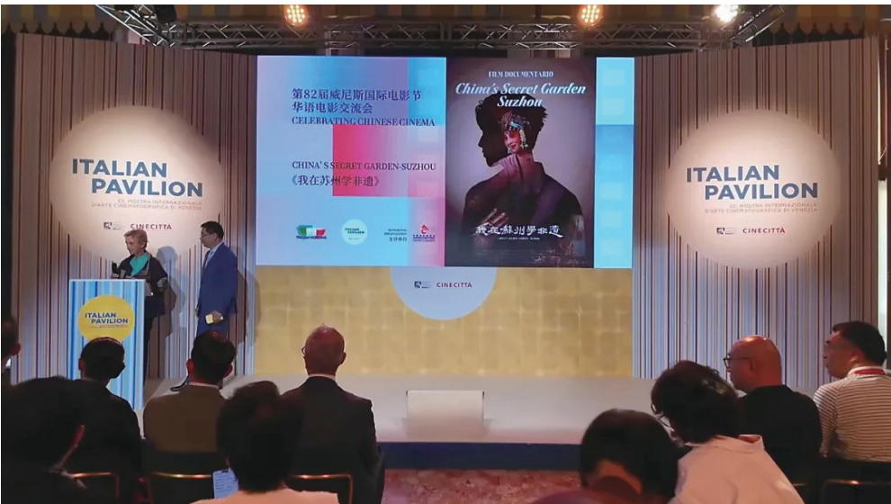
第 82 届威尼斯国际电影节华语电影交流会《我在苏州学非遗》影片推介现场。