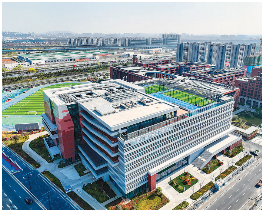
目前，南京南部新城全民健身中心已进入竣工验收、消防验收阶段，综合体运营单位也已进驻开展前期工作。项目投用后将服务新城及秦淮区并辐射周边区域，为市民提供丰富的运动体验和体育消费场景。图为3月20日，航拍全面建成的南部新城全民健身中心。

泰州国际集装箱码头本地货源约占85%，不断增长的吞吐量反映出泰州“1+4”主导产业的蓬勃发展。3月7日，上港集团ICT（姜堰港）项目启动，将上海港港口服务前置到泰州内河港口，在线上直接衔接上港集团信息化管理服务平台，在港口领域实现长三角多地与上海的互联互通、共建共享，使“泰州造”产品能够更快、更优、以更低成本出口。 赵晓勇 徐敏 王昊