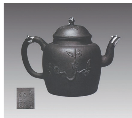
英国维多利亚阿尔伯特博物馆藏孟臣款圆肩直筒壶