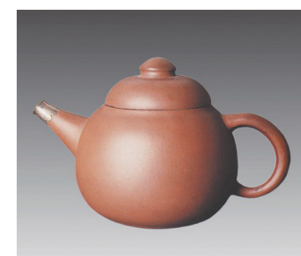
柏林城堡博物馆藏龙蛋壶