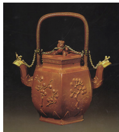
哥本哈根国家博物馆藏双流壶