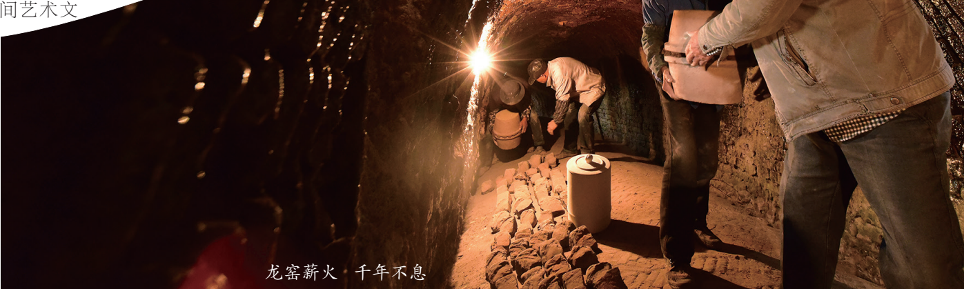
龙窑薪火 千年不息