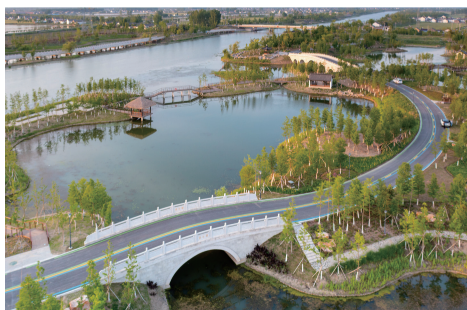
路、桥、闸融为一体，成为既便利又美观的交通廊道。（资料图）