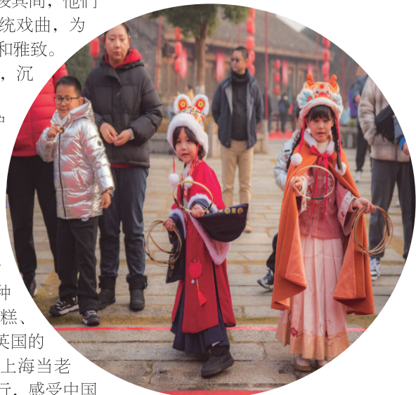
传统游戏吸引小朋友的参与。

感。”亚当说。暮色降临，百米长的非遗“板凳龙”在古风街道中巡游，时而蜿蜒游走，时而盘曲成圈，天空中有无人机组成的飒爽凤凰，飘舞而来，与地面上的巨龙遥相呼应，传统与现代科技相映成趣，烟花绽放天际，照亮整个山镇。游客们手牵手放着烟花，旋转、舞蹈，在烟火与星光中迎接新年的到来。唐娟 葛勇