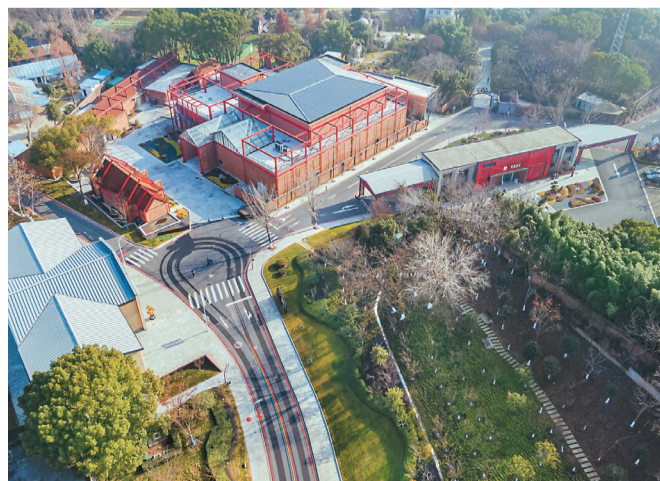
日前，江苏省文化和旅游厅发布公告，确定南京市梅钢工业文化旅游区等8家旅游景区为中国4A级旅游景区。据了解，梅钢工业文化旅游区正吸引越来越多的游客走进景区，沉浸式体验钢铁文明。

在江苏自贸区改革创新推动下，三个自贸片区2022年生物医药产值达到2500亿元左右，其中苏州片区超过1300亿元，一批创新药获批上市。2023年前三季度，江苏省获批9个一类创新药，其中5个来自自贸试验区。（刘亢 杨绍功 朱程）