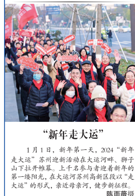
“新年走大运” 1月1日,新年第一天,2024“新年走大运”苏州迎新活动在大运河畔、狮子山下拉开帷幕。上千名参与者迎着新年的第一缕阳光,在大运河苏州高新区段以“走大运”的形式,亲近母亲河,健步新征程。