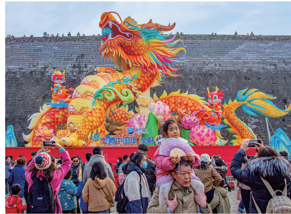
元旦假期,南京老门东景区花灯璀璨,吸引许多市民和游客前来赏灯游玩,欢度假期。

在单项排名中,苏州工业园区、昆山经济技术开发区、苏州浒墅关经济技术开发区跻身“进出口总额”单项十强榜单,分别位列第1、第2和第10。苏州工业园区、昆山经济技术开发区、南京经济技术开发区跻身“实际使用外资”单项十强榜单,分别位列第3、第7和第8。 孟旭