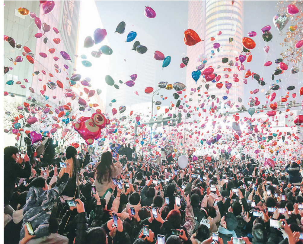
南京:迎接2024新年 1月1日零时,人们在南京新街口放飞气球,迎接新年的到来。

此外,《条例》明确自贸试验区应当发挥先行先试作用,开发区强化吸引外资的功能优势和带动作用,各地应当结合本地发展规划和比较优势,鼓励和引导外国投资者在国家制定的鼓励外商投资产业目录和本省重点领域内进行投资,促进重点产业强链补链延链。 王梦然