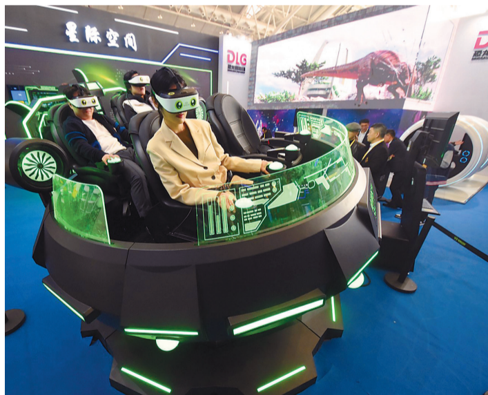
元宇宙引擎、文物AI全息互动、裸眼3D显示、5G大运河沉浸式体验……11月23日,智慧旅游发展大会暨智慧旅游示范展示活动在南京国际博览中心举办。

11月中旬,南京迎来最美秋景。位于紫金山前湖畔的乌柏堤已进入最佳观赏期,火红和金色的树叶在湖面留下斑斓倒影,又与古老明城墙、巍巍紫金山遥相呼应,到处都是暖色调美景。图为南京钟山植物园前湖月牙堤。