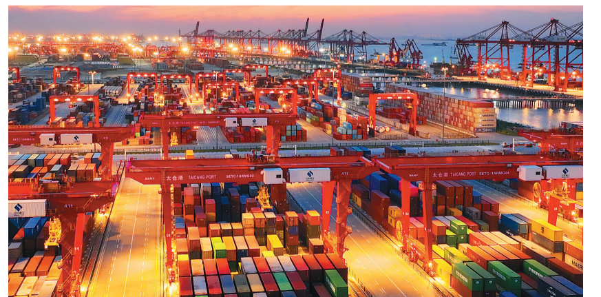
▲太仓港集装箱码头灯火通明,一片繁忙。

目前,苏州高新区累计集聚外资企业近2000家,其中世界500强企业投资项目61个。(陈雨薇 陈悦勤)