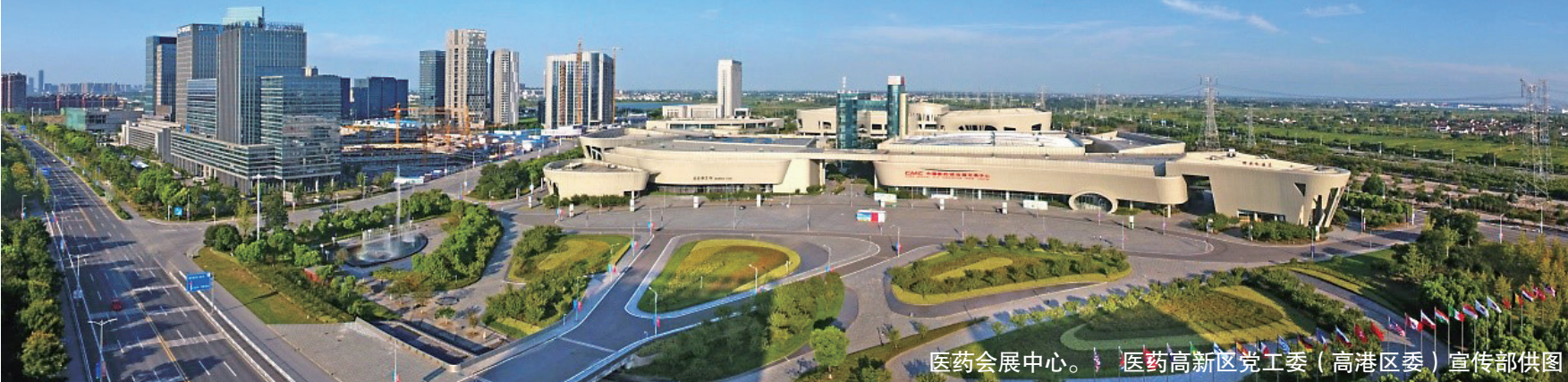
医药会展中心。