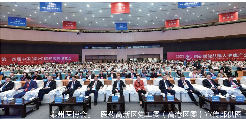
泰州医博会。

泰州位于江苏中部，有着2100多年的建城史，是国家历史文化名城、中国优秀旅游城市、全国文明城市，连续三年被评为中国最具幸福感城市。泰州市正在致力推进人民满意的高质量发展，加快建设令人向往的康养名城，热忱欢迎八方宾朋前来体验不一样的水城慢生活。