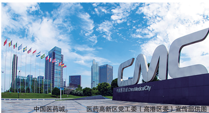
中国医药城。