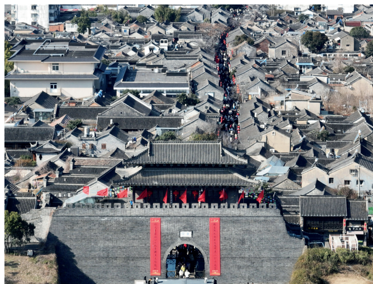
▲广陵明清古城,作为扬州古城的主体,这里很好地保留了浓厚的人文气息,是“记得住乡愁”的好地方。

“扬州紧扣高质量发展这一首要任务,锚定产业科创名城建设‘主航道’,突出产业为要、创新驱动、数字赋能,坚持产业科创与科创产业同步发力,制造业与服务业双轮驱动,创新链、产业链、人才链、资金链‘四链’协同,激发内在工商基因,增强发展创新动能,政企合力、共同发力,大干三五年,奋力过万亿。”扬州市委书记王进健表示,扬州力争到2025年实现工业开票过万亿元,“十五五”期间实现地区生产总值过万亿元,书写千年古城新的荣光。