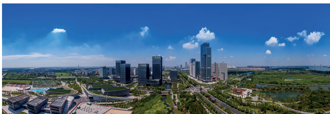
快速发展的扬州城。

新型食品产业集群 采用新原料、新技术、新方法,推动淮扬菜预制化研发、生产及冷链物流,布局运动营养食品、儿童配方食品、特医食品等功能性食品,推动新型加工储藏关联材料设备研发,培育“世界美食之都”爆款美食IP等新业态、新模式。