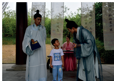
▲金陵小城的汉服、古筝表演，吸引了游客观看。小朋友感受传统文化。