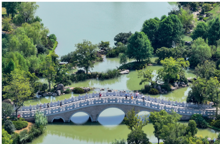
▲日前，由中新社国际传播集团、中国新闻图片网主办，中新社国际传播集团江苏分公司、南京牛首山文化旅游区承办的“美丽中国·发现四季极美牛首”主题影像大赛举行，面向全国组织、征集有关“春夏秋冬”牛首山的四季摄影和短视频作品。图为牛首山美景。