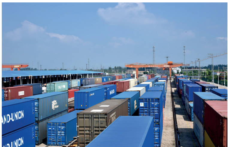
▲徐州淮海国际陆港。