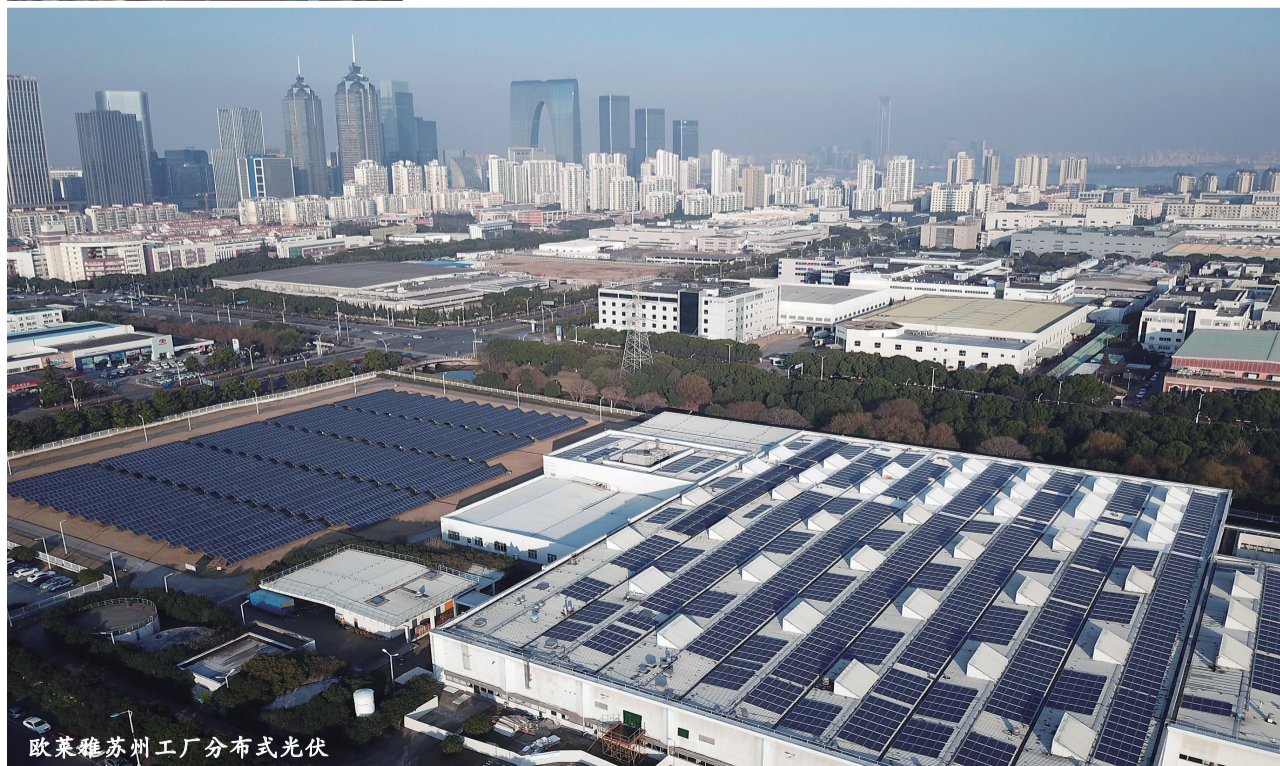
欧莱雅苏州工厂分布式光伏