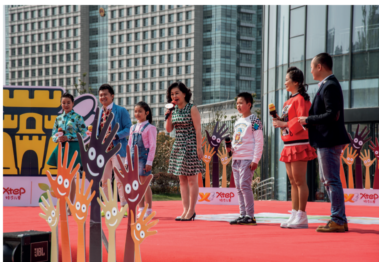
▲中国中央电视台“大手牵小手”栏目走进“童声”基地。