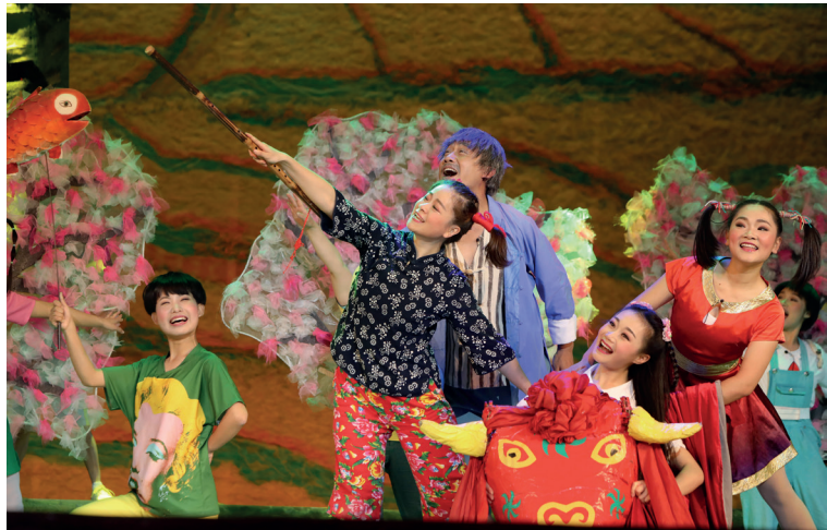
▲儿童剧《田梦儿》剧照。

心向阳光，温暖绽放。今年6月，由江苏省南通市通州区“童声里的中国”少儿艺术创作基地出品的儿童公益电影《向日葵中队》在江苏多个学校上映，让成千上万的孩子在观影中感受到了爱与成长的力量。