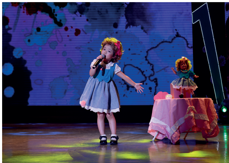
▲江苏省青少年音乐“小茉莉花奖”声乐大赛。

高雅艺术进校园、纯美文学进校园活动达4000余场，既走进剧院，也深入田间；既走进城市，也深入乡村，受益近400万人次。