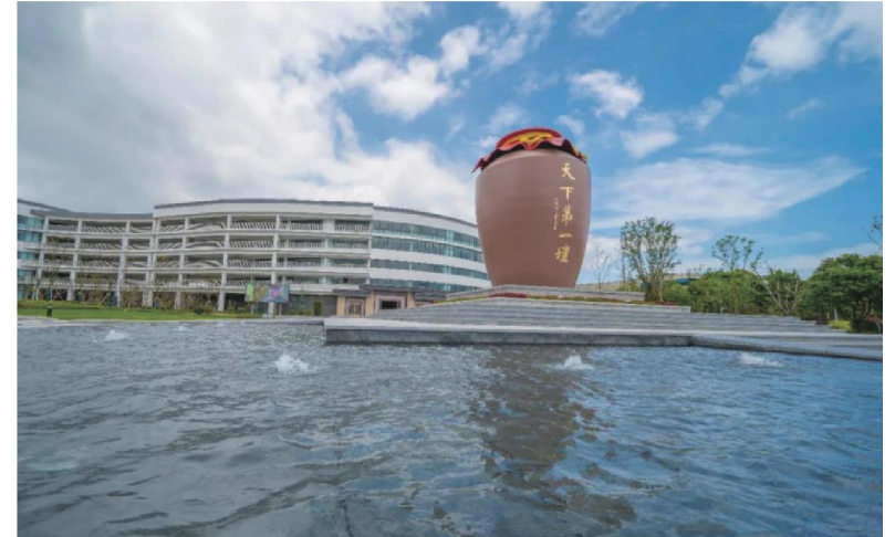
洋河酒廠文化旅遊區

亮的底色，也是宿遷最為寶貴的資源。以創建國家生態文明建設示範市為抓手，大力推進生態經濟化、經濟生態化，加快打造讓綠水青山得到充分展現、金山銀山得到充分體現的“江蘇生態大公園”，生態文明建設滿意率連續4年全省第一。這個夏天，邀您邂逅瀾灩湖光，遇見森