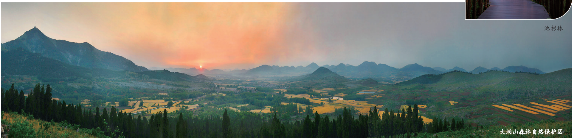
大洞山森林自然保护区