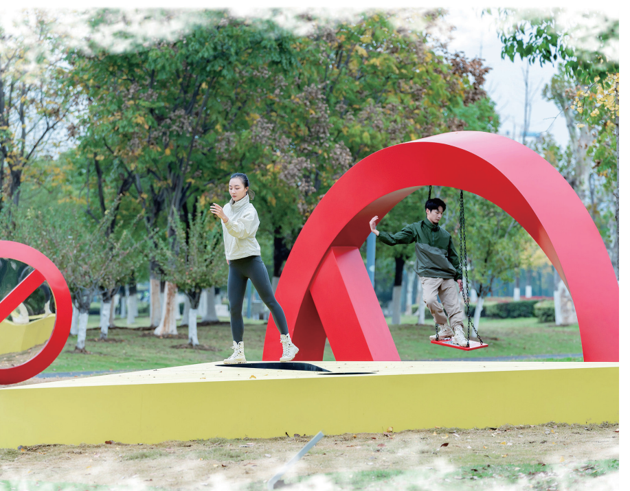
焦兴涛作品《江畔虹影》