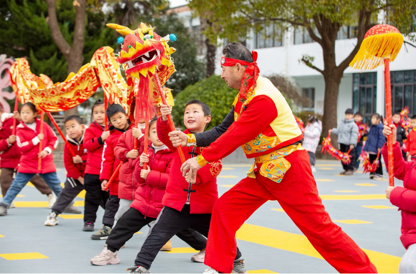
非遗文化薪火相传

研究计划项目2项，累计荣获国家科技进步奖4项，中国专利奖20项，省科学技术奖26项。大力实施“海安英才计划”等人才工程，先后引进、入选国家级人才计划22人、省“双创人才”200余人、省“双创团队”12个、高层次创新创业人才超1200人，建成“长三角海归创新创业海安基地”。人才综合竞争力、全社会研发投入占比、高新技术产业产值占比等指标均居江苏第一方阵。现代服务业持续攀高，电子商务、物联网建设、远程医疗、智慧海安、休闲旅游提速发展，汇聚科技服务、软件技术服务企业500余家，成功打造一批省级现代服务业集聚示范区。现代农业加快发展，农业现代化水平稳居江苏第一方阵，是中国首批基本实现农业现代化的20个地区之一。“一粒米、一根丝、一只蛋、一滴油、一群鱼”农业现代化“五个一”国字号品牌成为海安独特而靓丽名片。建筑业快速发展，拥有建筑企业500余家，先后获得“鲁班奖”“国家优质工程奖”“詹天佑奖”等建筑业重要奖项百余项。