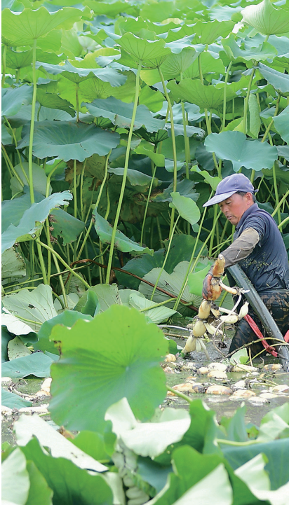
“美丽经济”——荷塘丰收季

新通扬河生态区是海安市北部新城大型配套民生工程。区内建有长约3.2公里、宽4.5米的跑步线路，彩色透水混凝土铺成生态环保路面，绿化覆盖率75%，全线布置的庭院灯和监控系统是夜跑的安全卫士，营造出美轮美奂、如梦似幻的运河夜景。儿童游乐区充满了孩子们的欢声笑语。人文景观紫公墓、观光塔与广福禅寺遥相呼应，相得益彰。