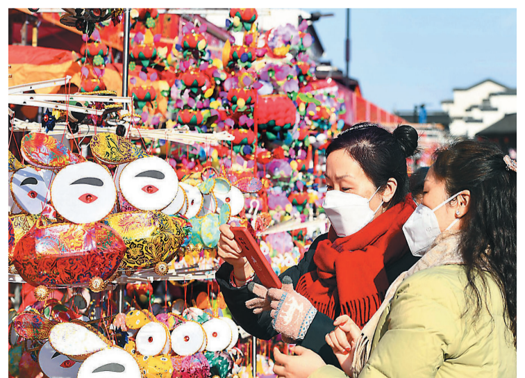
一月二十七日，南京夫子庙花灯市场各式花灯琳琅满目，吸引了众多游客和市民前去赏灯拍照。杨素平 摄