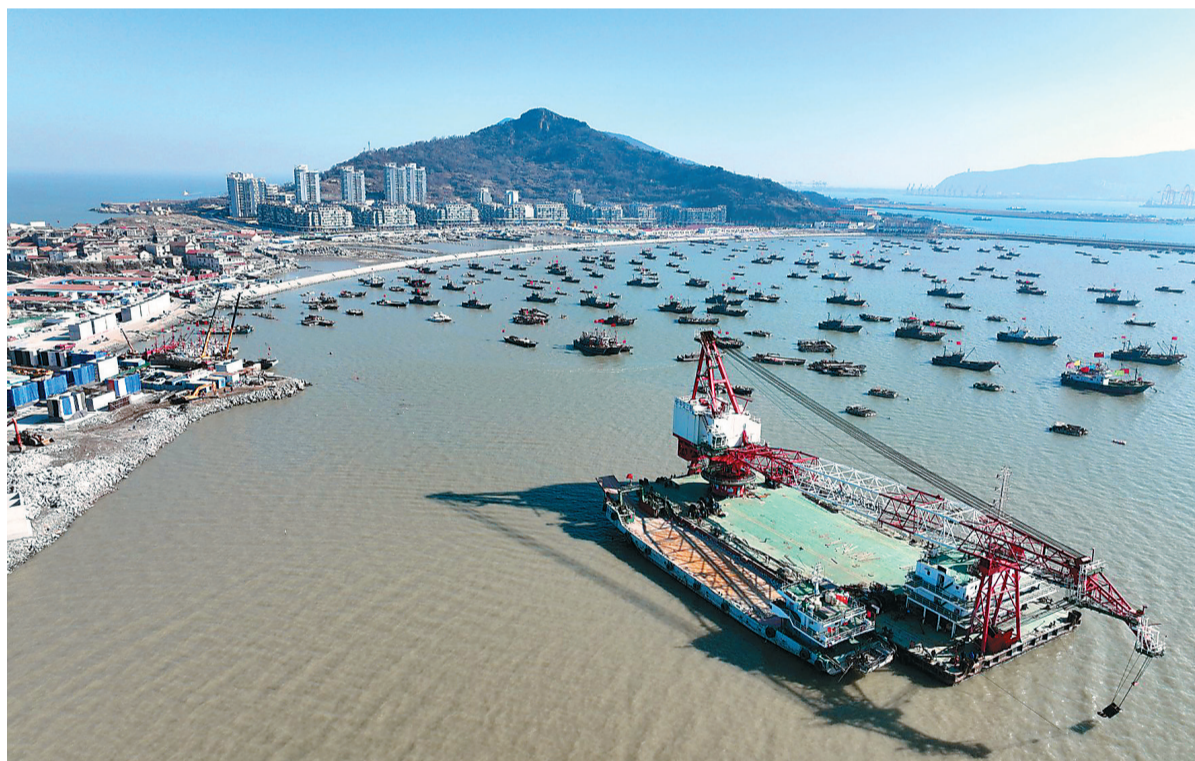
为二月二十九日，连云港市连云区国家级中心渔港进入码头主体工程施工阶段。

此外，江苏省工业和信息化厅今年将全面推动绿色制造。具体来说，将推进绿色工厂、绿色园区、绿色供应链建设和绿色设计产品生产开发，创建省级绿色工厂300家左右。王拓 许海燕 王静