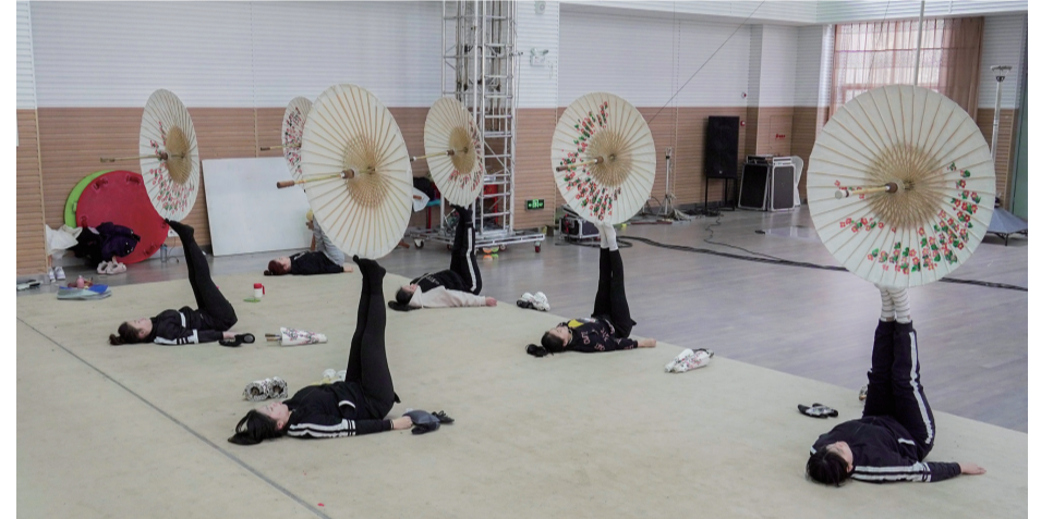
演员们刻苦练习动作技巧。