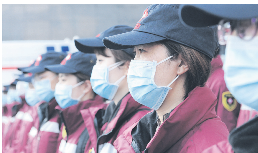
▲4日，江苏省派出的国家紧急医学救援队从江苏省人民医院集结出发奔赴湖北。

在江苏工作、学习的外籍人员较多，江苏省外办高度重视。根据江苏省委、省政府应对疫情联防联控工作机制方案要求，外办主要领导担任组长成立工作专班，全力协调做好疫情涉外应对工作，每日组织精干翻译力量，在中文疫情通报的基础上，