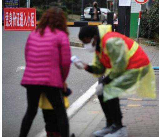
小朋友等着测量体温的家人。