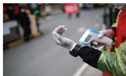
上岗前，欧莱德先测量了自己的体温。