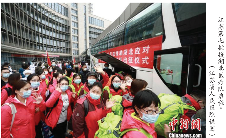
江苏第七批援湖北医疗队启程。