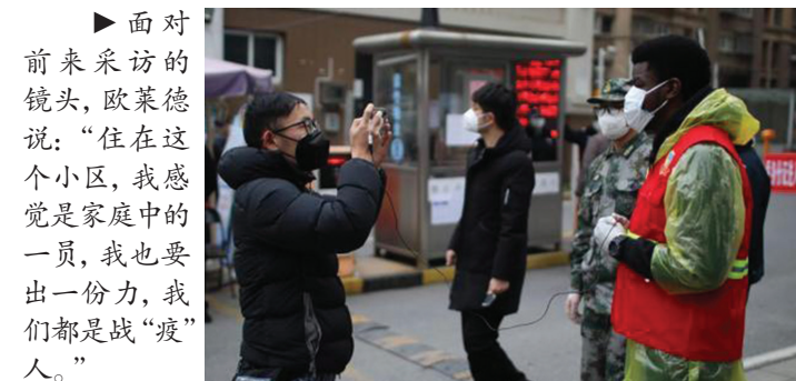
面对前来采访的镜头，欧莱德说：“住在这个小区，我感觉到家庭中的一员，我也要出一份力，我们都是战“疫”人。”